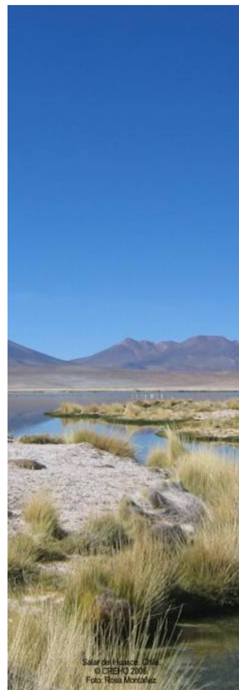
Salar del Huasco, Chile.

Para mayor información sobre la estrategia envíe un correo a info@creho.org o descargue http://www.ramsar.org/cop9/cop9_doc26_s.pdf