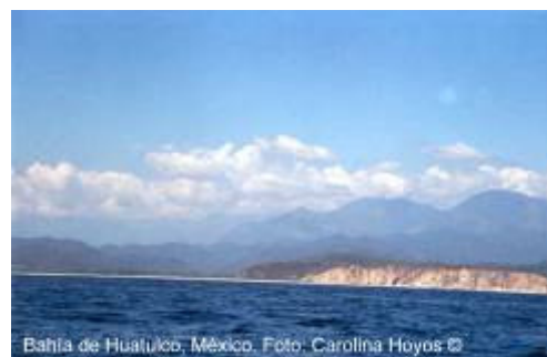
Bahía de Huatulco, México.

Para descargar el documento visite: http://www.semarnat.gob.mx/dgpairs/pdf/oceanos_costas.pdf