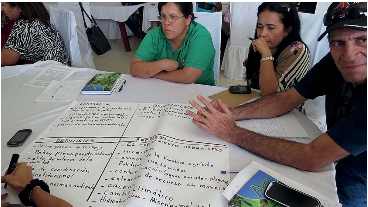
Taller en Santiago, Veraguas, 14 de febrero de 2014