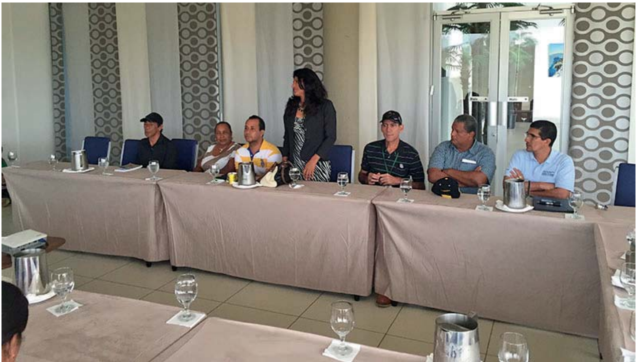
Taller en Santiago, Veraguas, 7 de noviembre de 2014