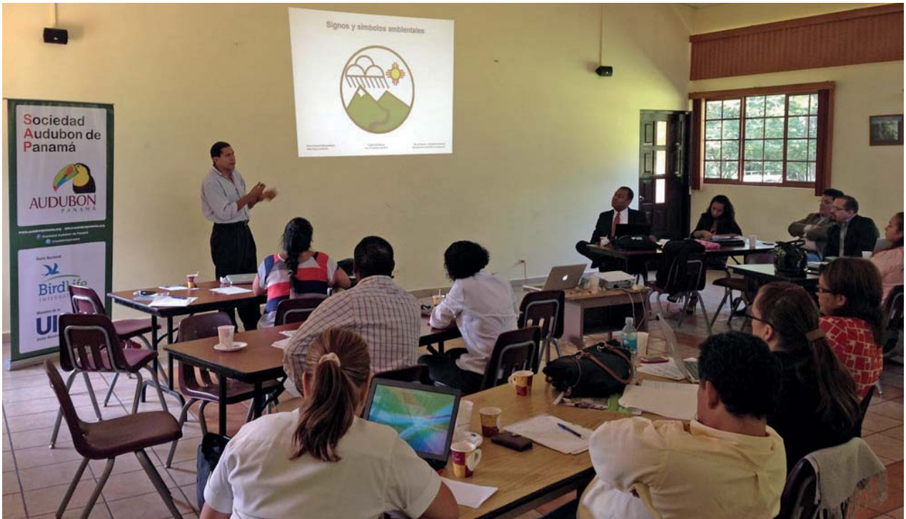
Taller en ciudad de Panamá, 16 de enero de 2014