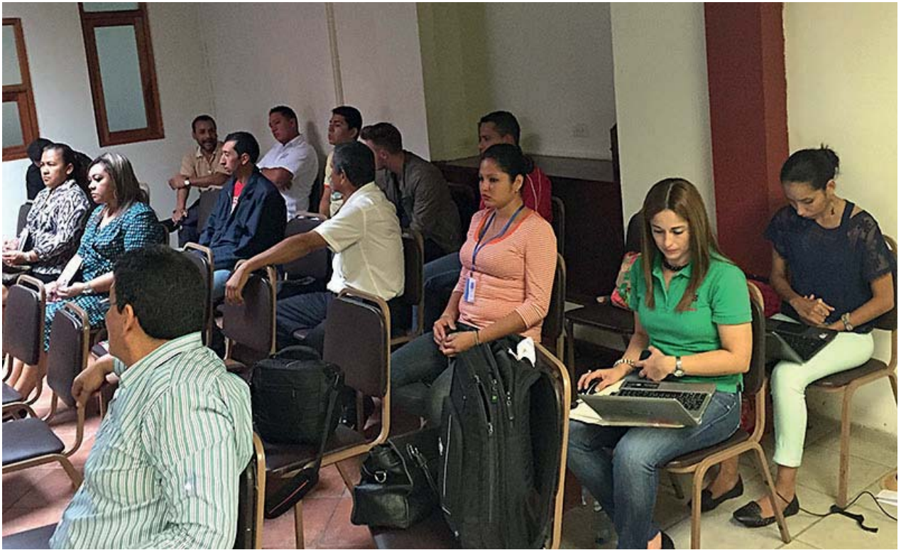
Taller en Volcán, Chiriquí, 6 de noviembre de 2014