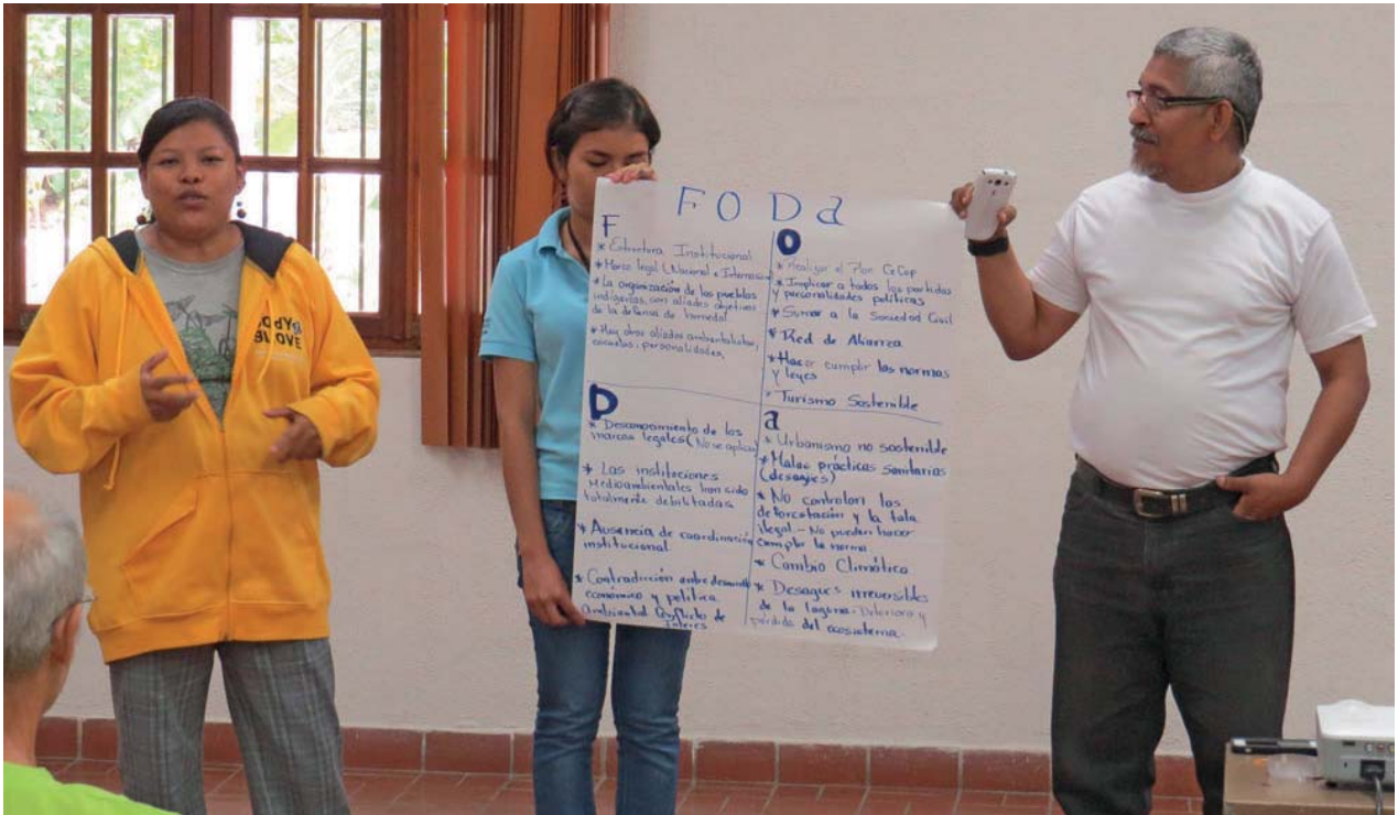
Taller en Ciudad de Panamá, 13 de marzo de 2014