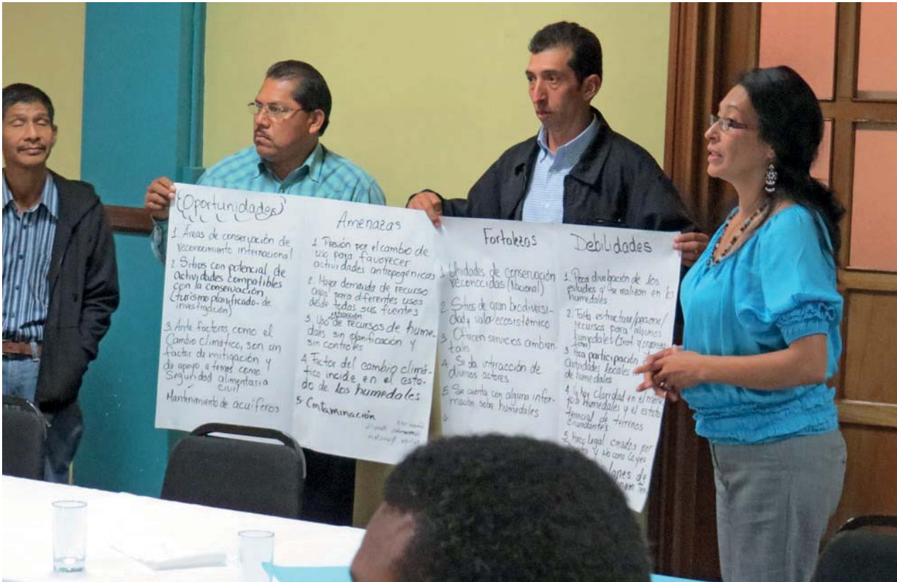
Taller en David, Chiriquí, 12 de febrero de 2014