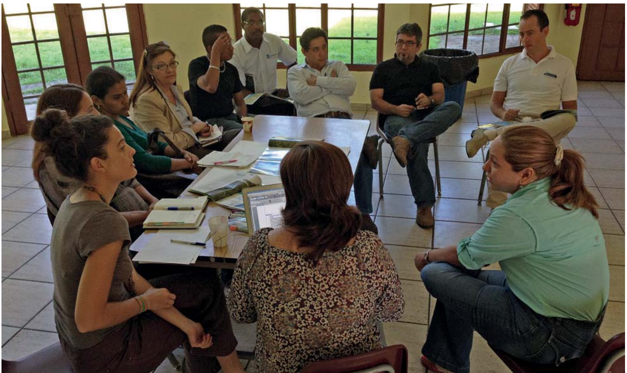
Taller en ciudad de Panamá, 17 de enero de 2014