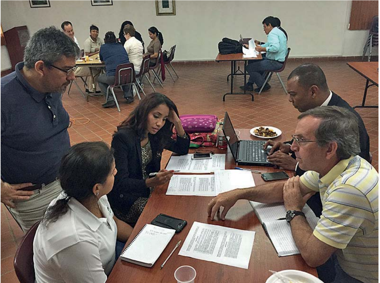
Taller en Ciudad de Panamá, 25 de noviembre de 2014