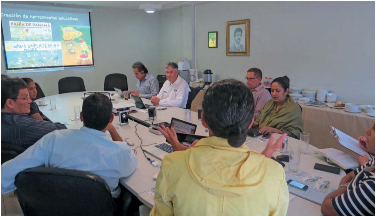
Reunión informativa con empresarios de APEDE, 14 de marzo de 2014